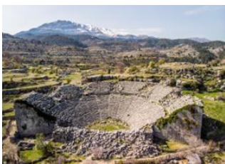
Cappadoce 500km - 6h Selge