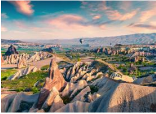
Vallée de Gömede 📍 14km - ⌚ 4h Vallée de Kizilçukur 📍 Cappadoce 📍