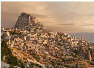
Avcilar 📍 18km - ⌚ 5h Göreme 📍 Cappadoce 📍